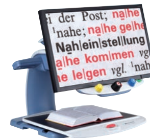
Bildschirmlese- und Vorlesegeräte